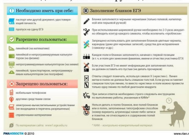
Памятка для тех, кто планирует сдавать ЕГЭ